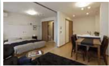
居室 (モデルルーム)